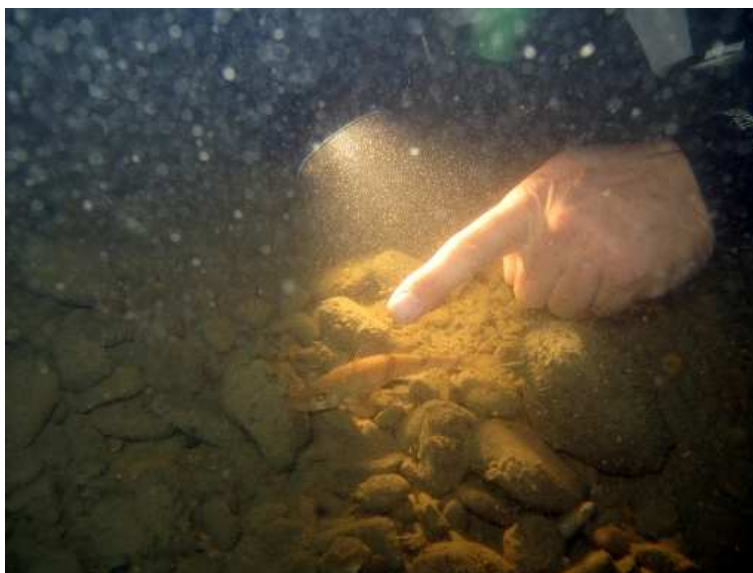
Apron de la Loue à 5 m de profondeur à Arc-et-Senans

En surface, une personne chargée de la sécurité désignée par le directeur de plongée suit les opérations sur la berge, épaulée par une personne disposant d'un canoë, pouvant subvenir rapidement à tout problème. Un équipement d'oxygénothérapie est systématiquement sur le site et tous les plongeurs sont équipés de lampe de position en plus de leur phare subaquatique. Chaque prospection mobilise 6 à 8 personnes et 3 opérations sont nécessaires par secteur.