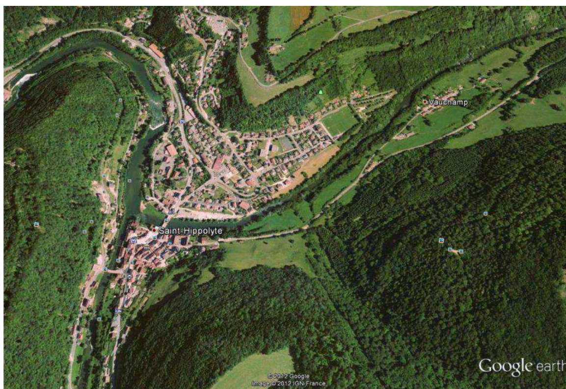
Carte satellite du secteur de St Hippolyte