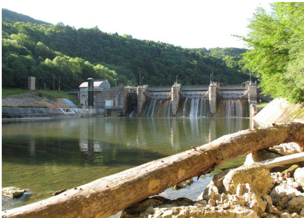
Barrage du Gros bois

Lors des prospections en plongée de 2009 sur le Doubs franco-suisse, le secteur Saint-Hippolyte - Barrage du Gros bois n'avait pas pu être effectué à cause des travaux de restauration du barrage. Ce linéaire n'ayant pas fait l'objet de recherche depuis longtemps, il a donc été sélectionné en 2012.