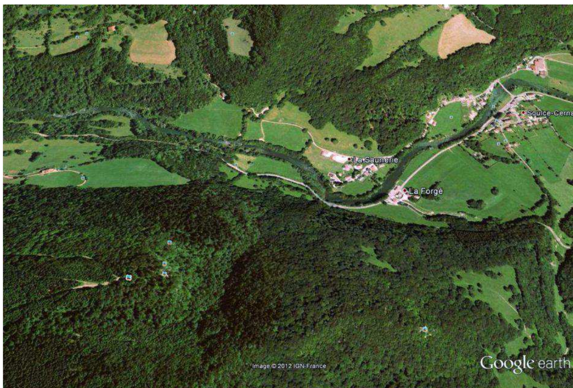
Carte satellite du secteur aval de Soult-Cernay