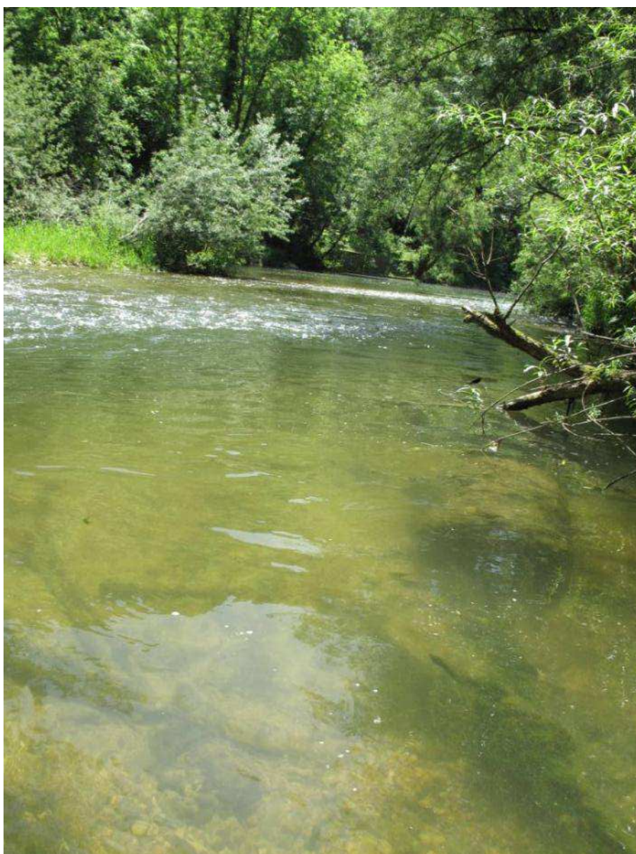
Succession de zones de mouilles et de radiers sur le Doubs à Soultz-Cernay