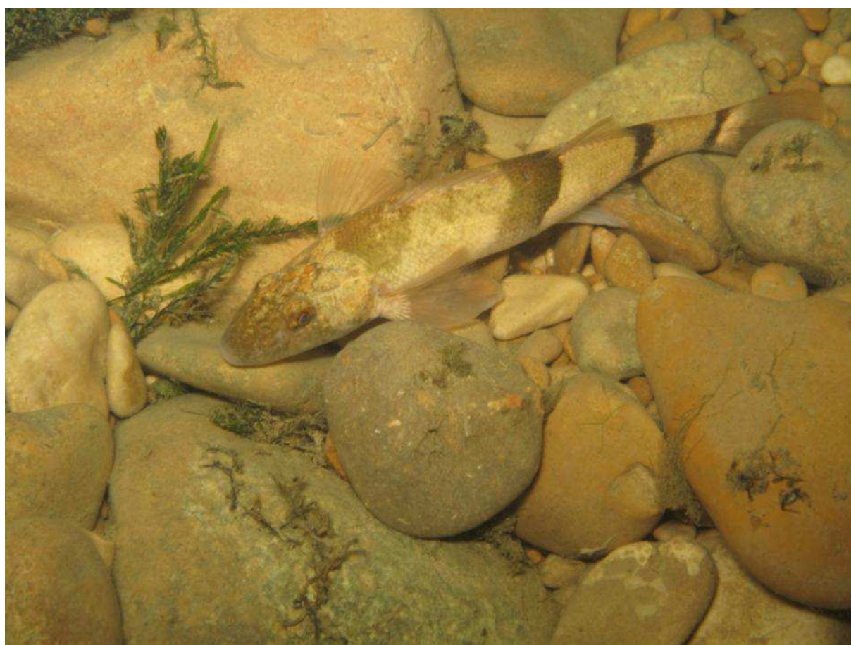
Apron de la Loue

Les observations d'alevins sont difficiles et des individus de l'année sont rarement observés avant le début de l'été.